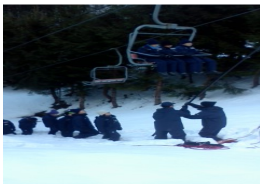
救助訓練(平成26年12月26日)