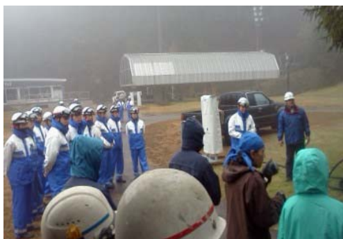
救助訓練(平成26年11月26日)