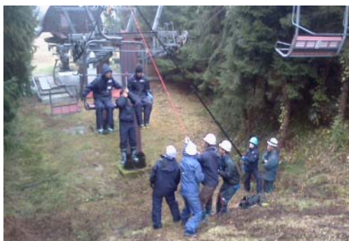
救助訓練(平成26年11月27日)