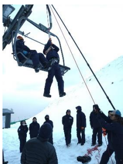
阿佐山第2リフトにて救助訓練実施・・・社内研修