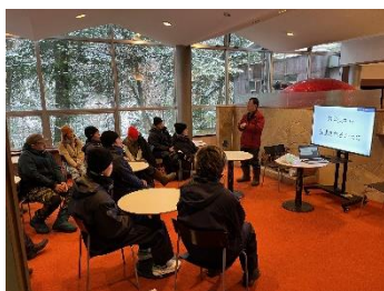
事前研修・・・運転取扱い及び安全行動について 索道マニュアル(アオイテクノサービス株式会社作成) の確認

当該リフトに初めて従事する者には、当日現場にて運転取扱い及び業務従事中の安全行動について担当社員が教育を行います。